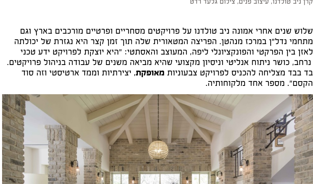
קרן ניב טולדנו, עיצוב פנים

השילוב המוצלח הוא שחייד עבודה את הרצון לפרוץ בתחום המשלב את הידע והניסיון בצדדים הטכניים עם הנשמה העיצובית שפיתחה לאורך השנים. תוך זמן רב מהרגע שגמלה ההחלטה בליבה נרשמה ללימודי עיצוב פנים במכללת 68 אותם סיימה בהצטיינות.