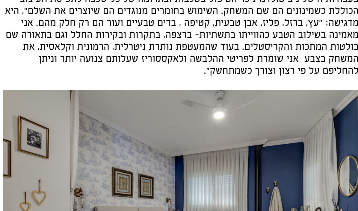
קרן ניב טולדנו, עיצוב פנים

היא מרבה לנסוע בעולם, לגבש קונספטים ולשאוב השראות מתערוכות מקצועיות ולנהל מסעות רכש ללקוחותיה: "את היתרון הגדול בליקוט פריטים מרחבי הגלובוס גיליתי תוך כדי המערכה על הבית שלי", היא מספרת. "באותה תקופה שוטטתי בין בירות המעצב באירופה ובמזרח בשילוב הטבע כהווייתו בתשתיות- ברצפה, בתקרות ובקירות החלל ואיך כל זה משפיע על העסק שלהם. כאן באה לידי ביטוי ההבנה המסחרית והעסקית שלי. אחת המשימות העיקריות שלי בפרויקטים כאלה היא להשביח את ביצועי העסק דרך החוויה שאני המשחק בצבע אני שומרת לפריטי ההלבשה ולאקססוריו שעלותם צנועה יותר וניתן להחליפם על פי רצון וצורך כשמתחשק".