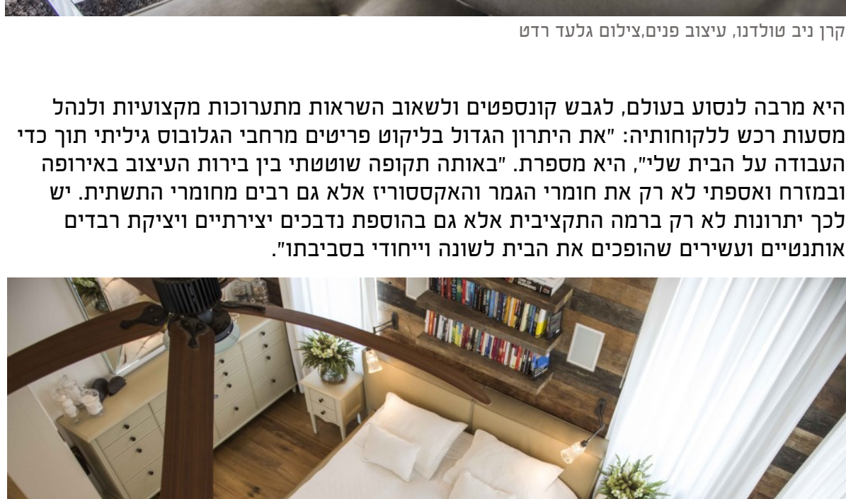
קרן ניב טולדנו, עיצוב פנים

היא מרבה לנסוע בעולם, לגבש קונספטים ולשאוב השראות מתערוכות מקצועיות ולנהל מסעות רכש ללקוחותיה: "את היתרון הגדול בליקוט פריטים מרחבי הגלובוס גיליתי תוך כדי המערכה על הבית שלי", היא מספרת. "באותה תקופה שוטטתי בין בירות המעצב באירופה ובמזרח בשילוב הטבע כהווייתו בתשתיות- ברצפה, בתקרות ובקירות החלל ואיך כל זה משפיע על העסק שלהם. כאן באה לידי ביטוי ההבנה המסחרית והעסקית שלי. אחת המשימות העיקריות שלי בפרויקטים כאלה היא להשביח את ביצועי העסק דרך החוויה שאני המשחק בצבע אני שומרת לפריטי ההלבשה ולאקססוריו שעלותם צנועה יותר וניתן להחליפם על פי רצון וצורך כשמתחשק".