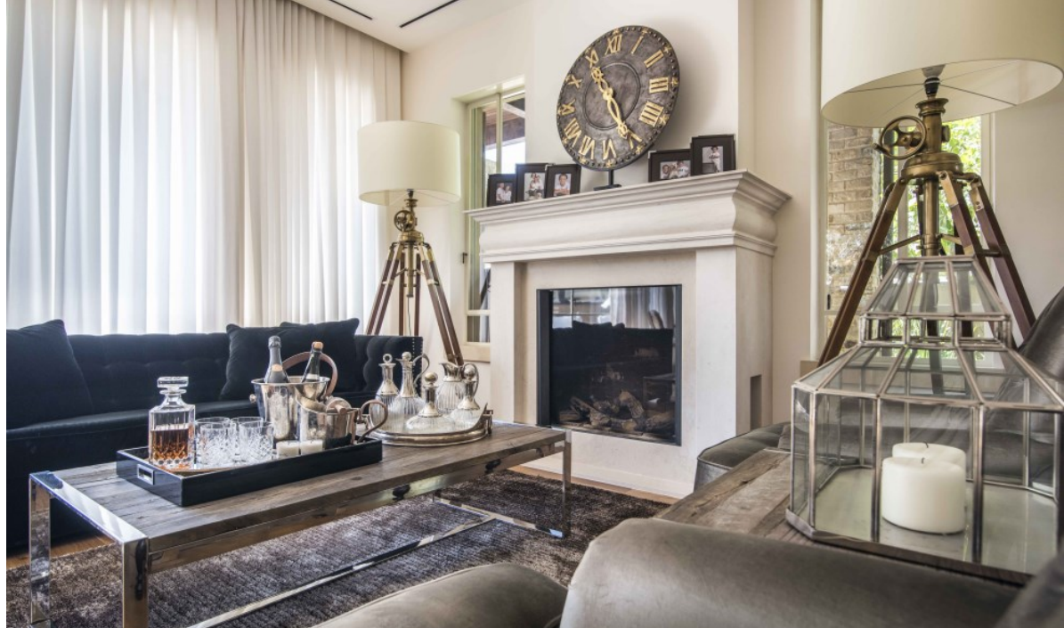
קרן ניב טולדנו, עיצוב פנים, צילום גלעד רט