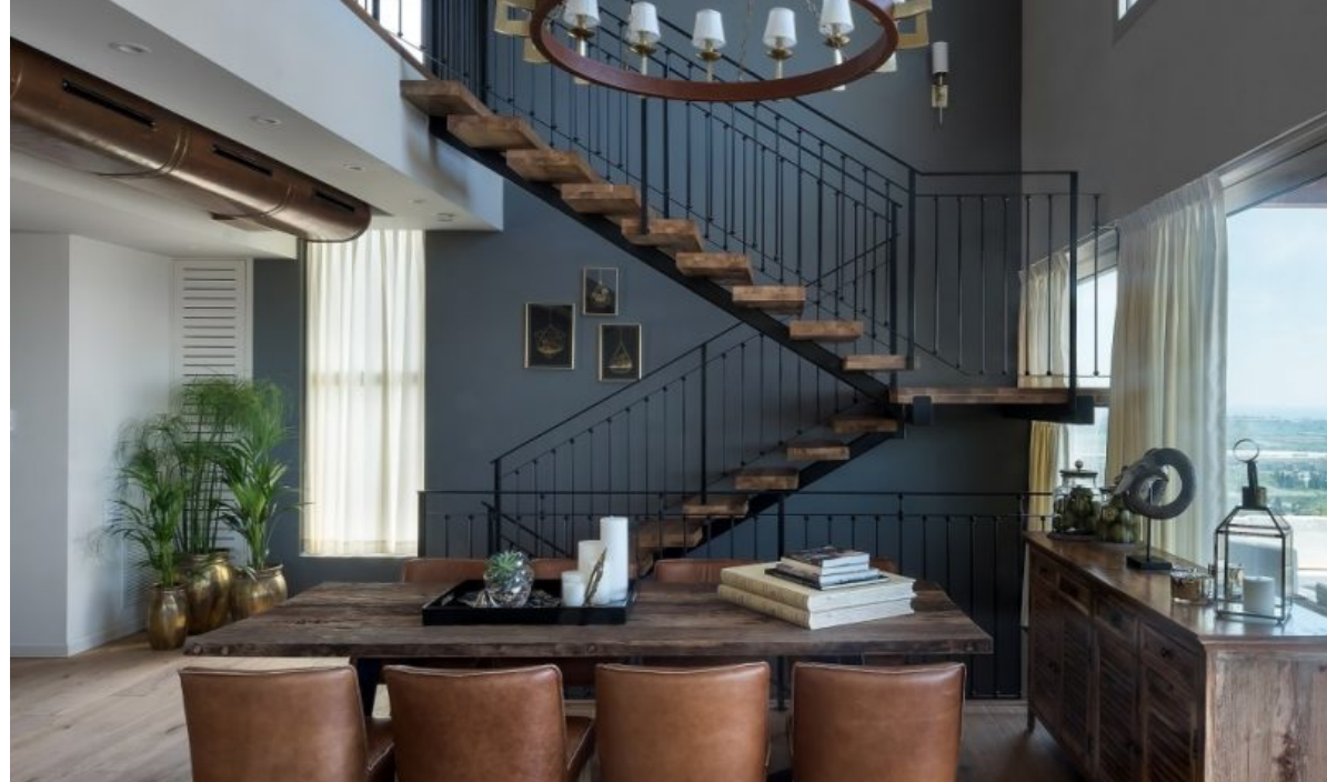
קרן ניב טולדנו, עיצוב פנים