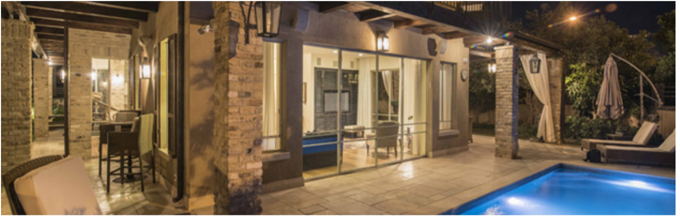
לחצו על התמונות הקטנות להגדלה

עיצוב פנים : קרן ניב טולדנו אדריכלות: מירית שטרן אשוח ואיקה דוידס